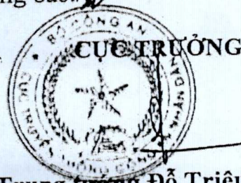
Trung tướng Đỗ Triệu Phong