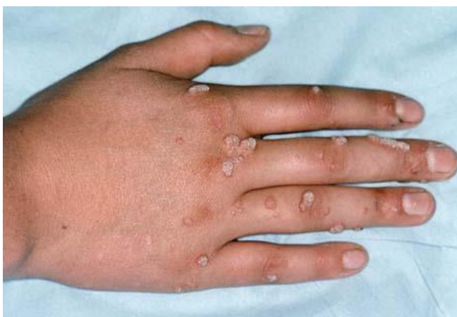
Sùi mào gà (sui-mao-ga-la-gi)

Trung tâm làm chủ và phòng tránh dịch bệnh Mỹ (Centers for Disease Control and Prevention - CDC) cảm thấy rằng có đến 50% phụ nữ và đàn ông đã từng đời sống chần gối nhiễm HPV tối thiểu một lần trong đời. Virus sùi mào gà cũng là đối tượng làm tăng nguy cơ bị ung thư cổ tử cung và ung thư dương vật. Do đó, các bạn phải tự trang bị cho mình một số kiến thức y khoa về Bệnh sùi mào gà cũng như những bệnh lý do virus HPV dẫn đến (nói chung) để phòng bệnh cho chính mình cũng như bạn tình.