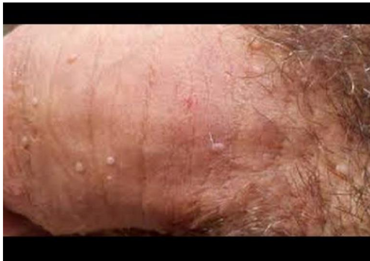
Hình ảnh sùi mào gà giai đoạn đầu tại bộ phận sinh dục