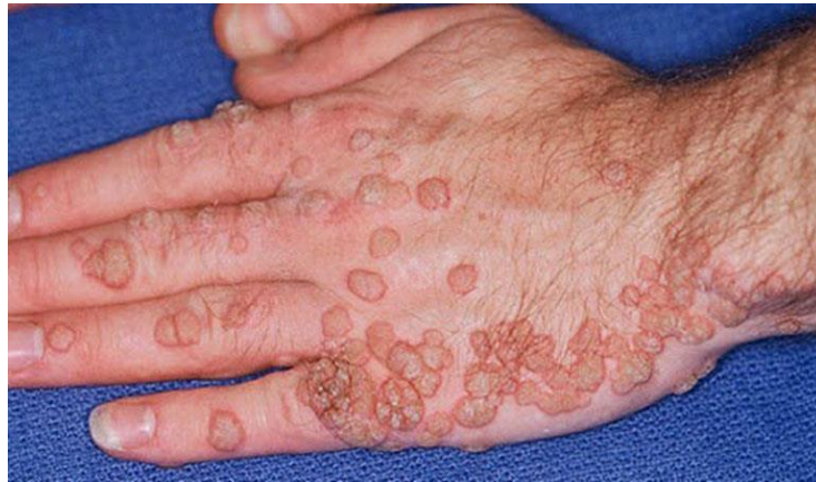
Hình ảnh sùi mào gà giai đoạn đầu hình thành tại bàn tay