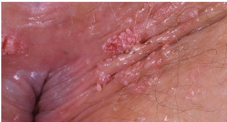
Hình ảnh sùi mào gà giai đoạn đầu tại vùng hậu môn